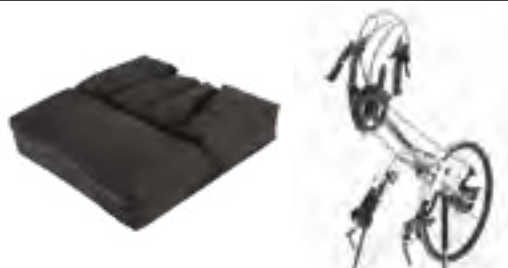
CUSCINO POSTURALE VICAIR ACTIVE 02 PAG. 89