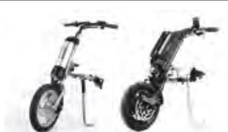
RUOTINO e RUOTINO 2 PAG. 100-101-102-103